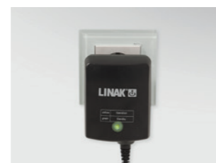
Elektronisches Schaltnetzteil (Switch Mode), direkt hinter Netzstecker integriert