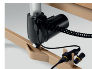
Aufnahmebuchse des Steckers zur Anbindung des elektronischen Schaltnetzteils (Switch Mode)