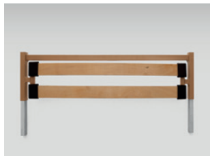
Bettverlängerung inkl. Seitensicherungsholme (auch nachträglich montierbar)