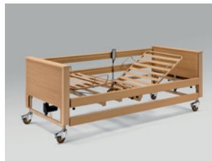
Liegefläche mit Metallstreben