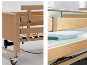
Links: aufsteckbarer Seiten- sicherungsholm Rechts: drehbarer Handlauf