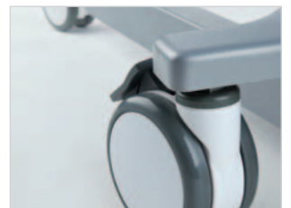
Extra große Doppelaufrollen für ungehinderten Transfer in den Fahrstuhl