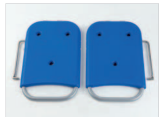
Die beiden SENTA PUR Liegelliftflügel können einfach und schnell in die am Sitz vorhandenen Adapter eingesteckt werden.