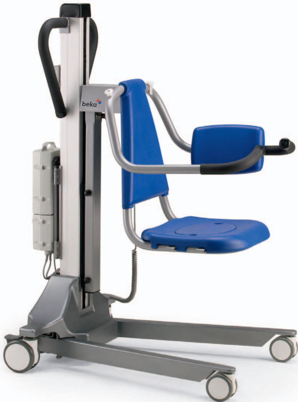
Kombi-Badelifter SENTA PUR