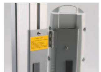
Der Akku ist abklappbar, damit auch engere Türen problemlos passiert werden können.